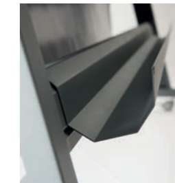
Sběrný zásobník na výtisky (volitelně)