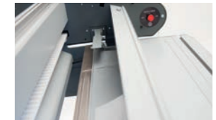
Automatické snížení přítlačných lišt, které při řezání drží materiál na místě.