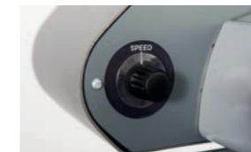
Nastavitelný regulátor rychlosti řezání (max. 100 m/min.).