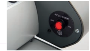
Accu View pro přesné řezání.