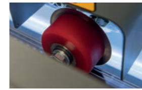
Samoostřící řezací kotouč pro dlouhodobou spolehlivost bez servisních nákladů.