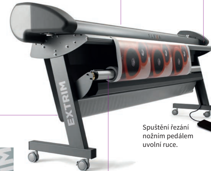
Spuštění řezání nožním pedálem uvolní ruce.